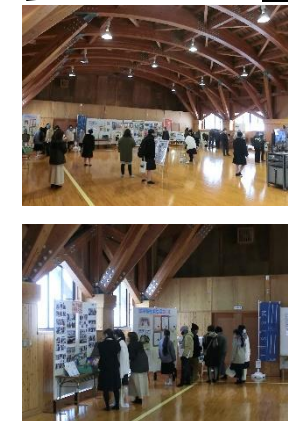
↑ 武道館に各学科・コースの紹介パネルや成果物を展示しました。